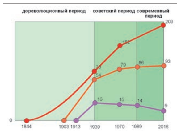
Иллюстрация 1. Усредненная динамика развития «высокоустойчивых городов» Дальнего Востока (красный цвет), городов постоянного сокращения (фиолетовый цвет) и среднего города макрорегиона (оранжевый цвет). Цифры обозначают тысячи жителей. Рисунок А. Г. Мазаева

Четвертый фактор, который оказывает серьезное влияние на характер развития города в условиях Дальнего Востока, — его административный статус. Наиболее выгодным является вариант либо постепенного повышения административного статуса, либо достижения наивысшего из возможных статусов — регионального центра, даже с учетом проводившихся в прошлом изменений в размере управляемого им региона. Четыре из восьми «высокоустойчивых городов» являются в настоящее время административными центрами регионов.