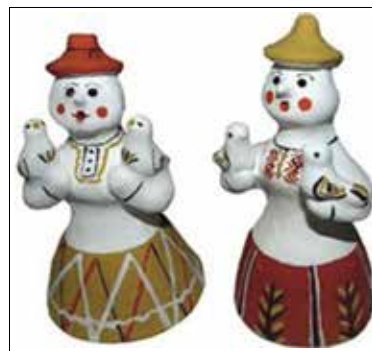
Иллюстрация 2. Каргопольская игрушка.

К особенностям техники карельских росписей относится сочетание работы кистью с обильным использованием «тычков» разных размеров. Она выполняется в свободной кистевой манере масляной краской, хотя более древняя роспись на этих же землях была геометрической. Берется достаточно широкая плоская кисть, на которую набирается краска двух цветов — с одного края основная, с другого — на оттенок светлее или белая. В процессе наложения