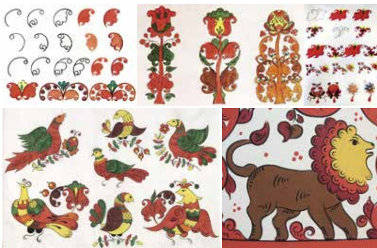
Иллюстрация 1. Созданные из растительных элементов животные борецкой росписи.

ния элементов городецкой росписи как части оформления интерьера представлены в работе Н. В. Голубинской [5].