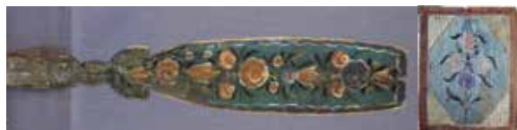
Иллюстрация 5. Готовые композиции карельской росписи.