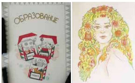
Иллюстрация 7. Работы студентов второго и третьего курсов, опубликованные в авторских соцсетях (портрет певицы и социальный плакат об образовании)

в своей совокупности придают карельским росписям торжественный, монументальный строй, который можно назвать эпическим, способным передавать чувство особой важности и значительности изображаемого.