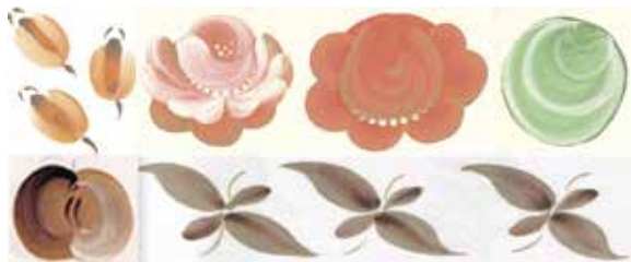
Иллюстрация 4. Основные элементы карельской росписи.