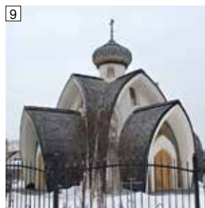
Иллюстрации 7–9: 7 — церковь иконы Божией Матери «Умягчение злых сердец», 2006–2008 гг., Краснодарский край [20]; 8 — церковь Новомучеников и исповедников Церкви Русской, 2010 г., г. Сочи; 9 — церковь Казанской иконы Божией Матери, 2018–2022 гг., Московская обл. По [17]