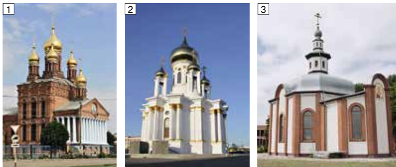
Иллюстрации 1–3: 1 — храм Иоанна Богослова, 1996 г. (ст. Кушевская, Краснодарского края) [5]; 2 — церковь Андрея Первозванного, 2014 г. (г. Москва); 3 — церковь Пантелеимона Целителя, 2001–2005 гг. (Калининградская обл.). По [15]