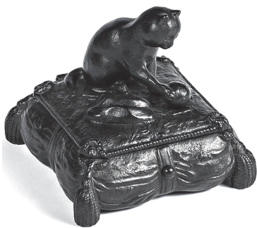
Иллюстрация 1. Коробочка «Кошка на подушке, играющая с клубком» по образцу в серебре «Кошка с клубком ниток» фирмы П. А. Овчинникова. Каслинский чугунолитейный и железоделательный завод. Отливка конца XIX — начала XX в. Чугун, литье, чеканка, покраска. Частная коллекция