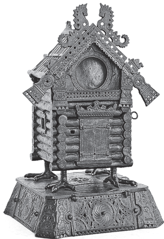
Иллюстрация 3. Подчасник «Избушка на курьих ножках» по модели 1870-х гг. М. Д. Канаева. Каслинский чугунолитейный и железоделательный завод. Отливка 1906 г. Формовщик Л. Баранов. Чугун, литье, чеканка, покраска. 28,6 × 19,5 × 17,9. Екатеринбургский музей изобразительных искусств

животное представлено более компактно, присутствуют пуговицы на перетягивающих подушку лентах, менее подробно решены детали рукоделия. Все это говорит о том, что ювелирная вещь, скорее всего, ее изображение стало образцом при создании модели для Каслинского завода. Иллюстрированное описание мануфактурной выставки вышло еженедельно, в качестве приложения к журналу «Всемирная иллюстрация», стоило 40 копеек и было доступно. Иллюстрация «Кошки» выполнена на высоком профессиональном уровне гравером Л. А. Серяковым по рисунку Э. П. Липсберга и опубликована в номере 3–4.