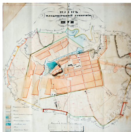
Иллюстрация 2. План Владимирской губернии уездного города Шуи, снятый в 1850 г. (Фонд Литературно-краеведческого музея им. К. Бальмонта, Шуя). Источник: https://www.okrugshuya.ru/about/old_shuya_maps_1850.php

в формах конструктивизма, созданный по проекту архитекторов Иваново-Вознесенского текстильного треста П. Трубникова и А. Стаборовского, и первый образцовый дом в фахверковом стиле, выпуск которых был налажен в 1924 г. на местном заводе для строительства Первого рабочего поселка в Иваново-Вознесенске из 144 домов четырех типов.