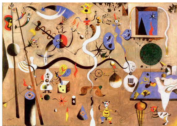
Иллюстрация 4. Фрагмент. Карнавал арлекина. Худ. Ж. Миро. 1924–1925 гг. Холст, масло. 66 × 93 см. Галерея Элбрайт-Кнокс, США, Буффало [9, 40]

ловека, пластические знаки в каллиграфическом исполнении вездесущей буквы S (правда, в строчном варианте) и цифры два (которая отчасти зеркалит рядом стоящий знак). Здесь следует кратко отметить специфику данных знаков с позиций пластических потенциалов. Английский художник и теоретик искусства У. Хогарт назвал эту линию «S-образной кривой», «волнообразной» или «змеевидной», снабдив свой труд множеством примеров, соответствующих диаграмм [13, 98, 101]. Тогда как в «Сиесте» Миро привлекают эти знаки для кодификации правого верхнего угла, где они кочуют на периферию, надежно заполняя регистр полосы собственным присутствием. Приведенный перечень знаков экспрессивно залит подвижным маревом голубого кобальта в фоновой живописи пространства холста. Все перечисленное — лишь миражи, силуэты структур жизни в период сиесты. Знаки на голубом фоне, несмотря на локальность, иероглифически мерцают, что производит эффект звездного неба. Холст Миро буквально становится растворенным эквивалентом полос моря и неба в живописи.