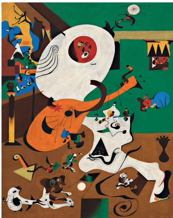
Иллюстрация 2. Фрагмент. Интерьер I. Худ. Ж. Миро. 1928 г. Холст, масло. 91,8 × 73 см. Музей современного искусства, США, Нью-Йорк [9, 40]

Возможно, что в художественной практике Миро весьма близко подошел к методу построения междисциплинарных связей психологии/поэзии/живописи через многократные сопряжения и синтез ( буквального/концептуального, текстуального/визуального, иррационального/структурного, живописного/графического ) знаков в едином поле сюжета абстрактных картин. В дневниковых записях того времени Миро писал: «...я работаю усердно, я направляюсь к искусству концепции, используя реальность как отправную точку, а не как конечный пункт» [9, 39]. Здесь мы видим отход от реальности, которая для Миро — лишь отправная точка, здесь впору задать вопрос: куда же отправляется художник далее? Какова его художественная концепция или концептуализация художественного? Но, взглянув на средневековую фреску, мы, вероятно, так же можем задать вопросом: почему знак звезды/снежинки равен по размеру голове человека; или как средневековый художник сократил фон сюжета до двух полос?