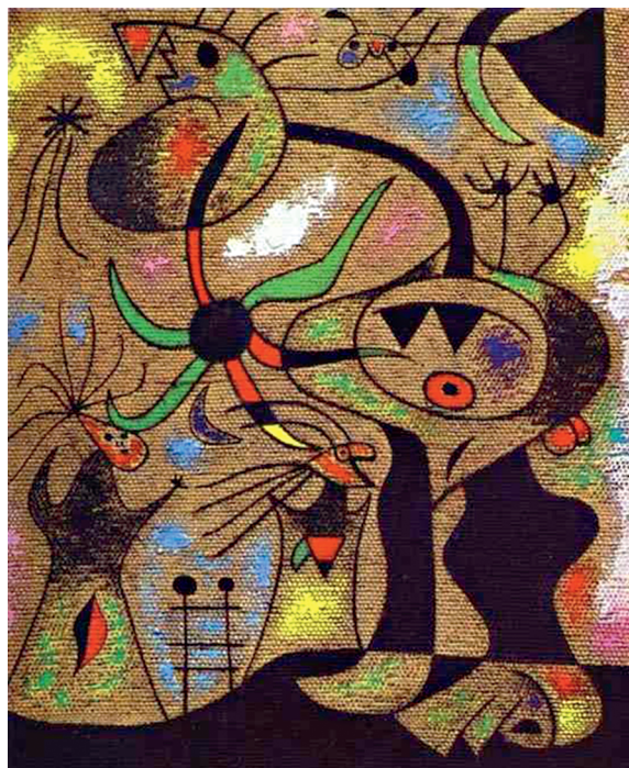
Иллюстрация 5. Лестница для побега. Худ. Ж. Миро. 1939 г. Холст, масло. 73 × 54 см. Частное собрание, США, Чикаго [9, 43]

«Песня соловья в полночь и утренний дождь», «Пробуждение на рассвете» [9, 69, 72]. Созданные Миро «Созвездия» отличает линейный узор, создающий «связи точек, определяющих странные, забавные создания, которые глядят на нас из узора» звезд небесной ткани искусства [9, 71]. Локальные осколки цвета «Созвездий» созвучны витражу, древнему искусству которого соположены музыка и свет, которые Миро наблюдал в соборе Пальма на Майорке [12, 66].