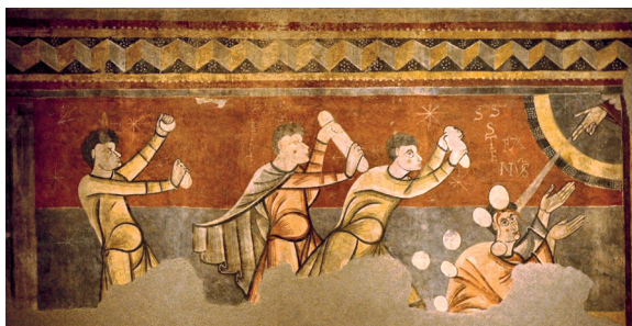
Иллюстрация 1. Побивание камнями святого Стефана. Фрагмент фрески. 1100 г. Национальный музей искусств Каталонии, Испания, Барселона. 2013 г.

тью особое значение представляет исторический очерк «Истоки. Древнекаталонское искусство», где сопоставлены средневековый и современный контексты каталонского искусства, что порождает продуктивное сопряжение исторических христианских традиций и формализованных отвлеченных пластических абстрактов современной живописи Ж. Миро в контексте анализа избранных работ художника [10, 24–28]. На приведенном изображении фрески из музея искусств в Барселоне в сюжете религиозной сцены на полосе красного фона мы видим схематические «снежинки» звезд, о вариациях которых пойдет речь далее в связи с живописью Миро (Иллюстрация 1). Цветность и условность форм живописи Миро берет исток в том числе из катакомбной архаики, каталонских фресок и мавританских фаянсов.