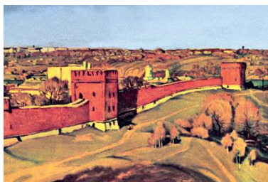
Иллюстрация 9. У древних стен крепости. Набор открыток 1981 г. изд-ва «Изобразительное искусство» с видами Смоленска. Худ. В. Г. Рогачев. 1976–1980 гг.

Л. Т. Булочко открывает взгляду зрителя массивную башню Орел (Иллюстрация 7). Он выбирает северный ракурс, в котором особо чет-