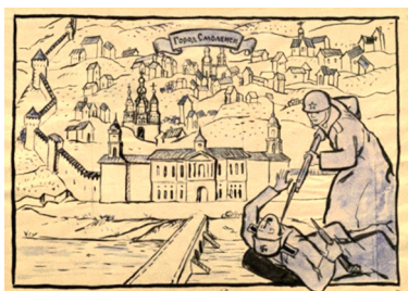
Иллюстрация 1. Рисунок для журнала «Фронтовой юмор». Худ. А. Д. Гончаров. По материалам выставки «Смоленская крепость России»