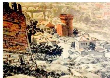
Иллюстрация 3. У древней смоленской стены. Акварель. Худ. В. И. Ружо. 1957 г.

последовательно складывался и развивался канон ее воспроизведения. Задача исследования состоит в определении единства и разнообразия трактовки архитектурного наследия крепости художниками середины XX — начала XXI в. Для проведения исследования мы привлечем методы сравнительного анализа, обобщения и исторического анализа. В целом мы можем обобщить их в качестве комплексного историко-художественного анализа единичного архитектурного сооружения.