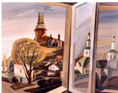
Иллюстрация 12. Большое окно. Худ. Г. В. Намеровский. 2002 г. Картон, темпера. 67 × 81. Источник: Художники земли Смоленской. Альбом-каталог. Смоленск, 2015. С. 104