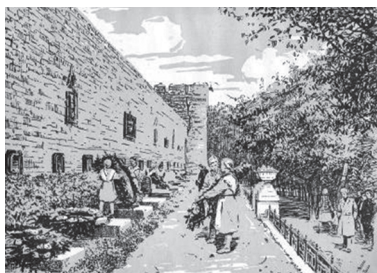
Иллюстрация 6. Могилы героев. Иллюстрация к альбому «Виды Смоленска» (Смоленск, 1959). Худ. А. Г. Алимов