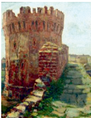
Иллюстрация 7. Вид на Смоленский кремль. Худ. Л. Т. Булочко. Вторая пол. 1950-х гг. Холст, масло