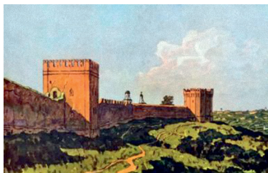
Иллюстрация 8. Крепостная стена. Башни Веселуха и Позднякова. Илл. из альбома «Смоленск», 1963 г. Худ. Б. Ф. Рыбченков