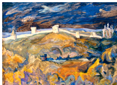
Иллюстрация 10. Город-герой Смоленск. Крепость. Худ. Ю. Ф. Дюженко. 1986 г. Холст, темпера. Смоленский государственный музей-заповедник