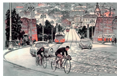
Иллюстрация 5. Большая Советская. Худ. В. И. Ружо

рует характерные пропорции, подчеркивает декоративные детали, весьма редкие для оборонительной архитектуры России рубежа XVI–XVII вв., а также избирает ракурсы, характерные исключительно для Смоленска.