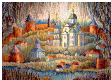
Иллюстрация 11. Смоленск на семи холмах. Город Православия. 2012 г. Шерсть, ручное ткачество. 65 × 110. Автор В. К. Никулина. Частная коллекция