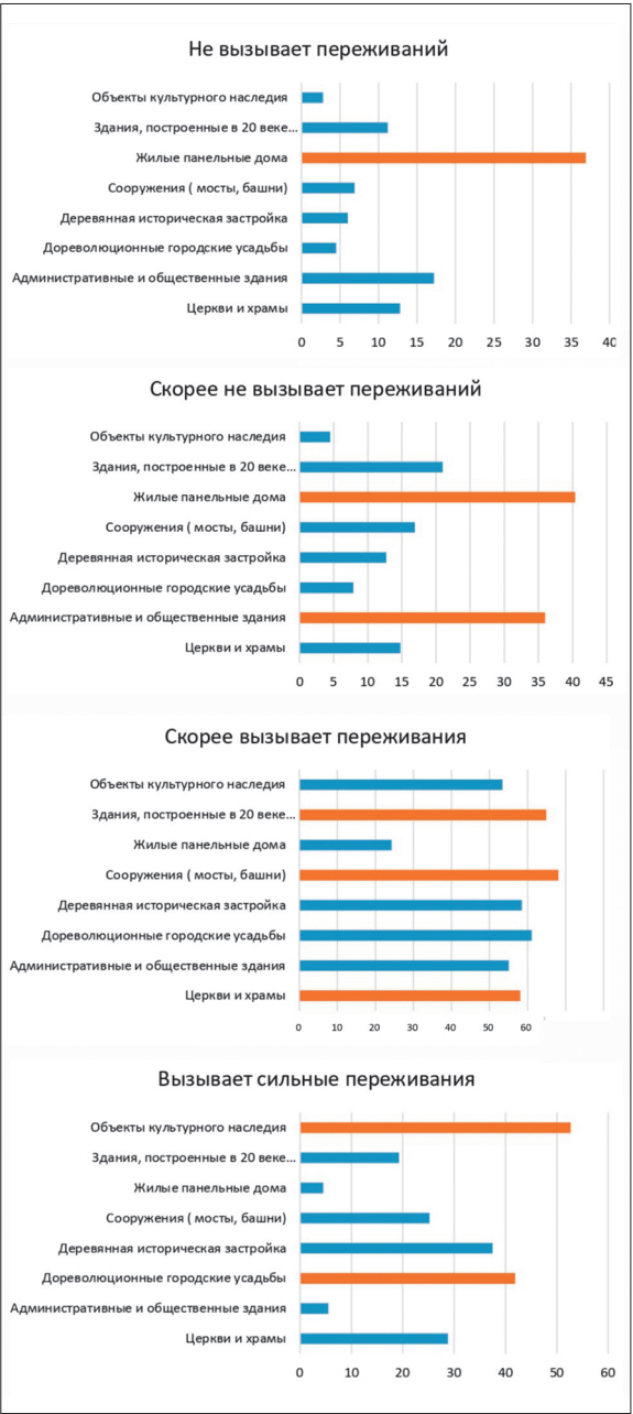
Иллюстрация 1. Связь между типологией, статусом и привязанностью. Автор М. С. Федорова. 2025 г.